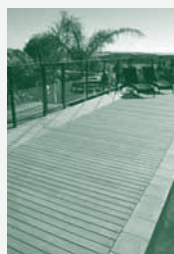
Decking Lame de terrasse Terrassendielen

DE: Die Verda Outdoor Serie setzt sich aus verschiedenen Produkten zusammen, die für den Außenbereich konzipiert wurden. Alle Produkte der Serie weisen die selben Eigenschaften auf und sind perfekt aufeinander abgestimmt um Ihren Außenbereich harmonisch, gemütlich und langlebig zu gestalten.