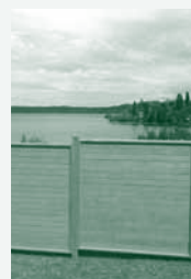
Fence Panel Panneau Zaunelemente