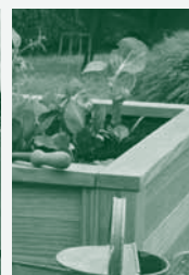
Garden Jardinière Hochbeete